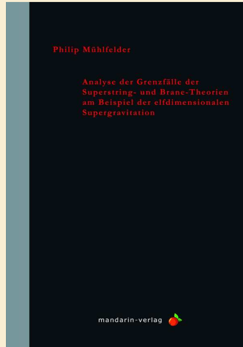
Umschlag in Schwarz/Grau, Autorenname und Titel in Feuerrot

Die Cover haben wir bewusst schlicht gehalten, um dem Charakter einer Dissertation bzw. eines Fachbuchs gerecht zu werden und nicht durch Grafiken, Bilder oder Farbspiele vom Titel abzulenken.